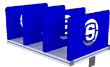
Sistema di scaffali con relativi divisori