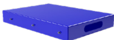
Vassoio per stampante